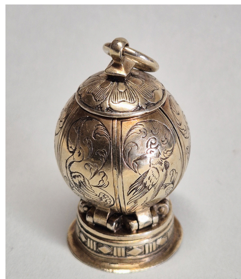
POMANDER, ANFANG 17. JAHRHUNDERT GESCHLOSSENER ZUSTAND SILBER, GRAVIERT UND VERGOLDET HÖHE: 5,8 CM PRIVATSAMMLUNG