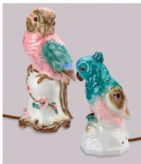
RAUCHVERZEHRER ›PAPAGEI‹ UND ›KAKADU‹, UM 1960 PORZELLANFABRIK HEINZ & CO., GRÄFENTHAL-MEERNACH HÖHE: 26 UND 19 CM MUSEUM OBERSCHÖNENFELD