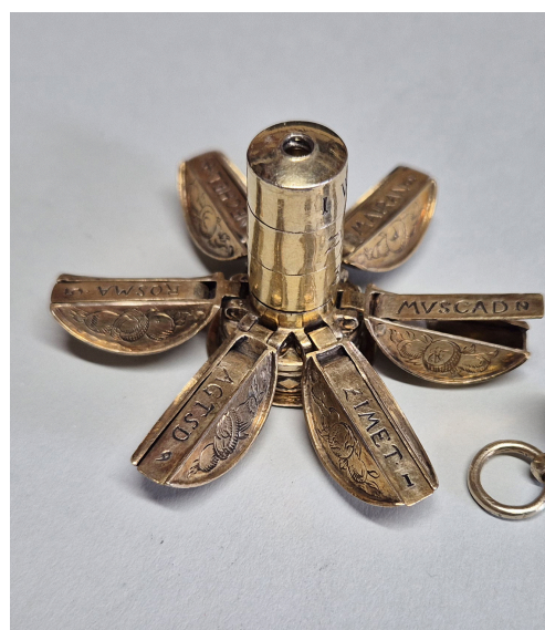
POMANDER, ANFANG 17. JAHRHUNDERT GEÖFFNETER ZUSTAND: SECHS SEGMENTE ZUR AUFNAHME DER EINZELNEN DUFTÖLE SILBER, GRAVIERT UND VERGOLDET HÖHE: 5,8 CM PRIVATSAMMLUNG

Hochaufgelöste Bilddateien stehen auf www.dachauer-galerien-museen.de/presse zum Download bereit