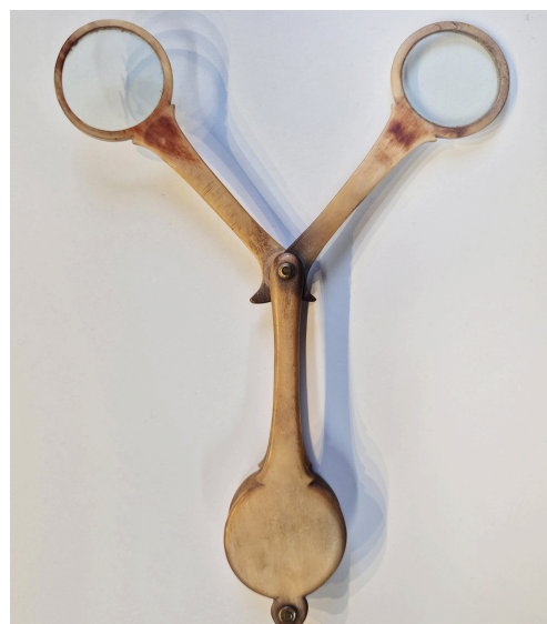
SCHERENBRILLE, UM 1820 HORN, GLAS LÄNGE (GESCHLOSSEN): 10 CM BEZIRKSMUSEUM DACHAU, HA-OP-7005