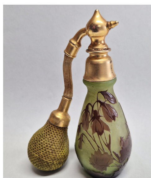
PARFUMZERSTÄUBER, UM 1910 WERKSTATT EMILE GALLÉ, FRANKREICH ÜBERFANGGLAS, MESSING, TEXTIL HÖHE: 12,5 CM SAMMLUNG MEININGHAUS