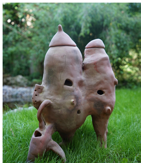
JUDITH EGGER (*1973) WURMHOTEL, 2023 TON UND ÜBERWACHUNGSVIDEO 28 X 28 X 40 CM