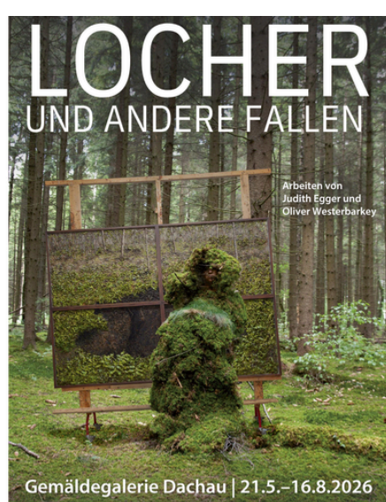
PLAKAT ZUR AUSSTELLUNG LÖCHER UND ANDERE FALLEN. ARBEITEN VON JUDITH EGGER UND OLIVER WESTERBARKEY

Hochaufgelöste Bilddateien stehen auf www.dachauer-galerien-museen.de/presse zum Download bereit