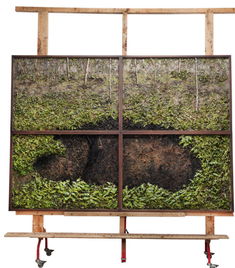
OLIVER WESTERBARKEY (*1969) SINKHOLE, 2023/2026 ERDE, STEINE, ÄSTE, PFLANZENTEILE, ACRYLDISPERSION, ACRYLFARBE, HOLZPANEELLE, STATIV