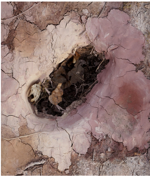
JUDITH EGGER (*1973) SECRET CHAPEL 4 (5-TEILIG), 2022 DIGITALFOTOGRAFIE AUF 310 G HAHNEMÜHLE KUPFERDRUCK 60 X 90 CM, GERAHMT 64 X 94 CM FOTO: JUDITH EGGER

Hochaufgelöste Bilddateien stehen auf www.dachauer-galerien-museen.de/presse zum Download bereit